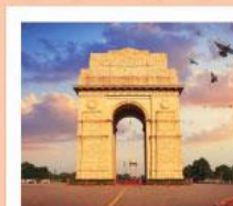
♥♦♦ India Gate