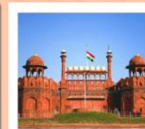
♥♦♦ Agra Fort