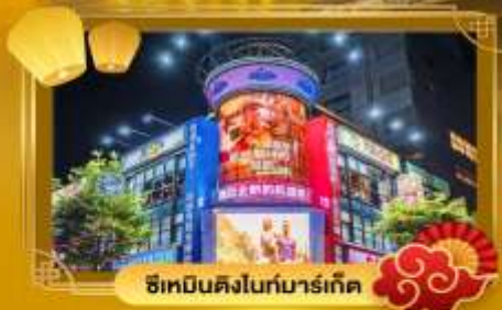
ช้อปปิ้งคืนไนท์มาร์เก็ต