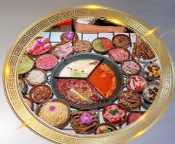
บุฟเฟ่ต์มือโหลงซิ่ง