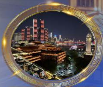
มือคำร้านอาหารวิวหลักล้าน