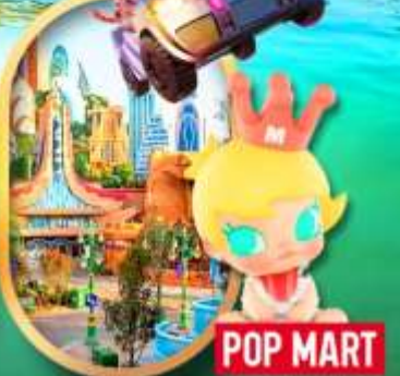
เลือกซื้อทัวร์เสริม เซี่ยงไฮ้ ดิสเนย์แลนด์