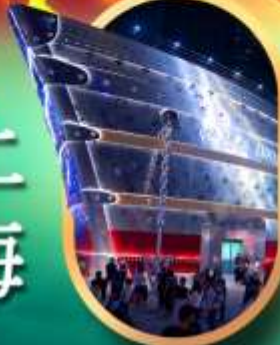
เรือคองคอร์ด