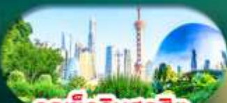
จุดเช็คอินสุดฮิต North Bund Shanghai

เซี่ยงไฮ้ หางโจว ล่องทะเลสาบซีหู ฟรีเดย์