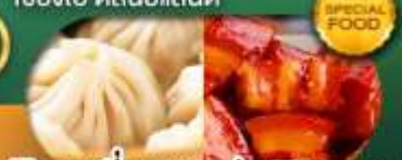
พิเศษ เสี่ยวหลงเป่า หมูแดงพอ เดินทาง ม.ค. - มิ.ย. 69