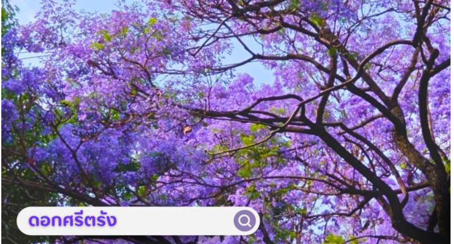
ดอกศรีตรัง

เดือนกันยายน: นำท่านชม ตลาดดอกไม้ไต้หวัน เป็นตลาดค้าส่งดอกไม้ที่ใหญ่ที่สุดของจีน เปิดทำการค้าตลอด 24 ชั่วโมง ไม่มีช่วงเวลาปิดทำการ โดยในปี 2566 ตลาดดอกไม้ไต้หวันมีปริมาณการซื้อขายดอกไม้โดยเฉลี่ยรวม 13,540 ล้านบาท คิดเป็นมูลค่า 13,570 ล้านบาท ถือเป็นตลาดค้าปลีก-ส่ง ผลิตผลทางการเกษตรที่ใหญ่ที่สุดในประเทศจีนอีกด้วย