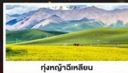
ทุ่งหญ้าจีเหลียน