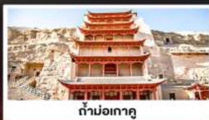
ถ้ำม่อเกาตุ