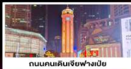
ถนนคนเดินเจียวฟางเป่ย์