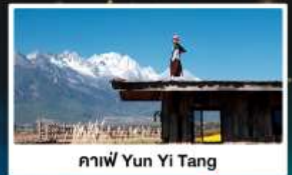
คาเฟ่ Yun Yi Tang