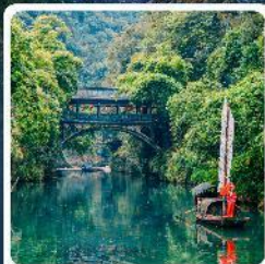
หมู่บ้านชาวน้ำเซียงหยาง