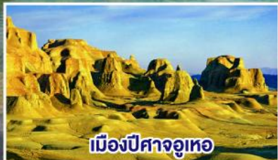
เมืองปีศาจอุทอ