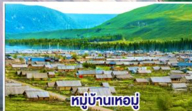
หมู่บ้านเหมอมู่