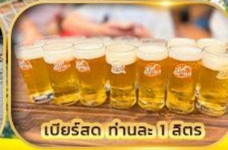
เบียร์สด ท่านละ 1 สติง