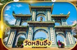
วัดหลินฮั่ง