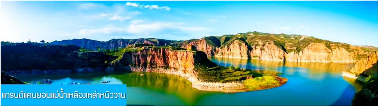
แกรนด์แคนยอนแม่น้ำเหลืองเหล่าหนิววาน

พักที่ DALATEQI SHNAGJING HOTEL โรงแรมระดับ 4 ดาวหรือเทียบเท่าในเมืองต้าลาเท่อ