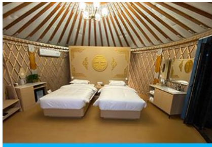
ห้องพักสไตล์มอโกเลียน