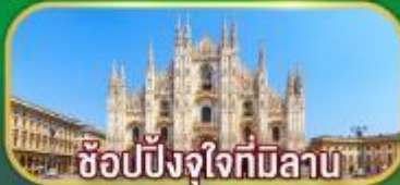
ช้อปปิ้งจุใจที่มิลาน

เดินทาง 07-14 เม.ย. 69 / 02-09 พ.ค. 69 27 พ.ค. - 03 มิ.ย.69 / 17-24 มิ.ย.69 22-29 ก.ค. 69 / 11-18 ส.ค. 69 16-23 ก.ย. 69