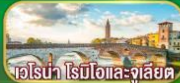
เวโรน่า โรมิโอและจูเลียต

• ชมเมืองเวนิสนครแห่งสายน้ำ • เอ็มมาเซอร์แมท จักรพรรดิไฟรอนบอร์เกรต • ชมเมืองเจนีวา ที่ตั้งองค์การสหประชาชาติ • ศาลาไทยที่โลซานน์ • เมืองมรดกโลกกรุงเบิร์น • ยอดเขาจุงเฟรา