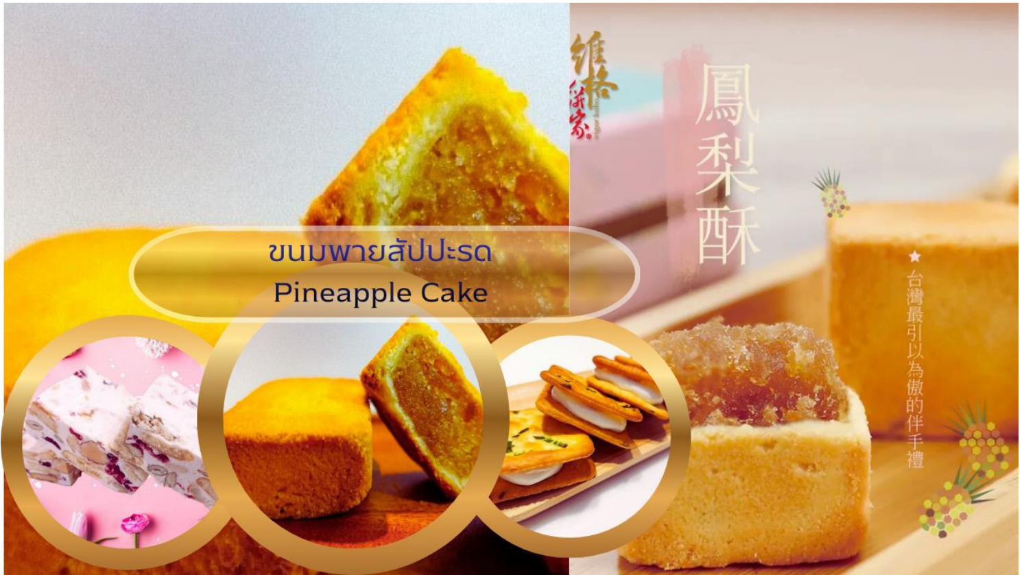
ขนมพายสับปะรด Pineapple Cake

นำท่านเดินทางสู่แหล่งช้อปปิ้งที่มีชื่อเสียงมากที่สุด เป็นที่นิยมมากที่สุดในไต้หวัน คือ ซีเหมินติง Ximending หรือที่คนไทยเรียกว่า สยามสแควร์เมืองไทย มีทั้งแหล่งเสื้อผ้าแบรนด์เนม สไตลว์วัยรุ่น กระเป๋า รองเท้ายี่ห้อดังต่างๆ ระดับโลก รวมทั้งมี ชานมไข่มุก ร้านอาหารแสนอร่อยให้ชิมอย่างมากมาย และยังมีร้าน ART TOY ชื่อดังที่กำลังเป็นกระแสอยู่ในขณะนี้ POP MART ซึ่งเป็นสาขาที่ใหญ่ที่สุดในไต้หวัน ตั้งอยู่ในใจกลางซีเหมินติง ให้ท่านได้ เลือกซื้อ ตุ๊กตา อาทิเช่น LABUBU, MOLLY, CRYBABY, SKULLPANDA, DIMOO, HIRONO และอื่นๆ อีกมากมาย