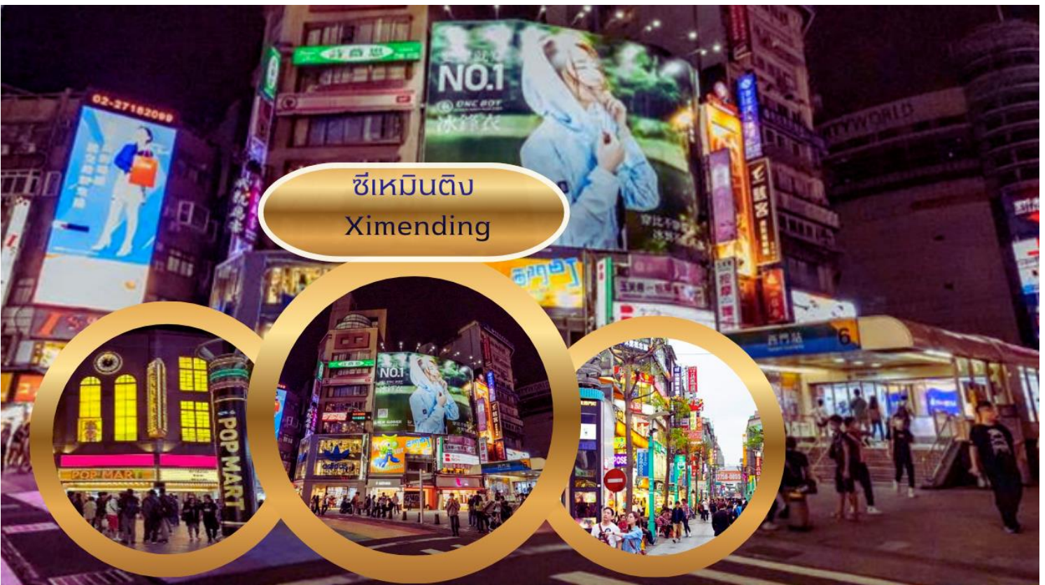
ซีเหมินติง Ximending

นำท่านเดินทางสู่แหล่งช้อปปิ้งที่มีชื่อเสียงมากที่สุด เป็นที่นิยมมากที่สุดในไต้หวัน คือ ซีเหมินติง Ximending หรือที่คนไทยเรียกว่า สยามสแควร์เมืองไทย มีทั้งแหล่งเสื้อผ้าแบรนด์เนม สไตลว์วัยรุ่น กระเป๋า รองเท้ายี่ห้อดังต่างๆ ระดับโลก รวมทั้งมี ชานมไข่มุก ร้านอาหารแสนอร่อยให้ชิมอย่างมากมาย และยังมีร้าน ART TOY ชื่อดังที่กำลังเป็นกระแสอยู่ในขณะนี้ POP MART ซึ่งเป็นสาขาที่ใหญ่ที่สุดในไต้หวัน ตั้งอยู่ในใจกลางซีเหมินติง ให้ท่านได้ เลือกซื้อ ตุ๊กตา อาทิเช่น LABUBU, MOLLY, CRYBABY, SKULLPANDA, DIMOO, HIRONO และอื่นๆ อีกมากมาย