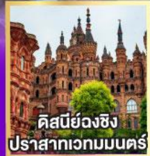
คิสบียองฉิ่ง ปราสาทเวทมนตร์