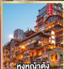
หงหล่าต้ง