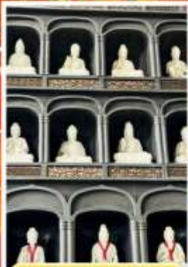
วัดไดชิซังเซอิไดจิ