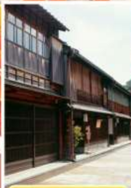
ย่านอิงาชิซายะ