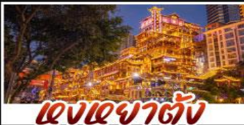
แสงอาคารต่าง

สัมผัสประสบการณ์เที่ยวจีนแบบเต็มอิ่ม ทั้งความล้ำสมัยของมหานครฉงชิ่ง และความงดงามตระการตาของธรรมชาติที่จุหล่ง ทุกการเดินทางเต็มไปด้วยความสะดวกสบายและคุ้มค่าที่สุด! ทุกการเดินทางเต็มไปด้วยความสะดวกสบายและคุ้มค่าที่สุด!