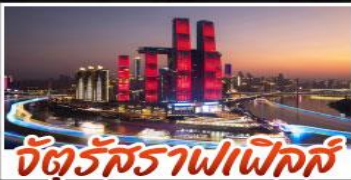
จัตุรัสราฟเฟิลส์