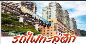
รถไฟฟ้า-คูตัก