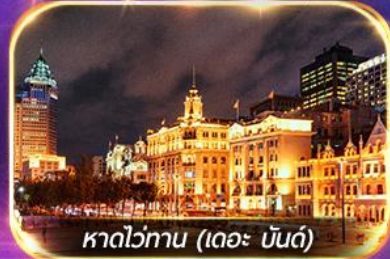
หาดว่อกาน (เดอะ บันด์)

เที่ยวดิสนีย์แลนด์เต็มวัน (รวมรถรับ-ส่ง)