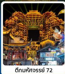
ตึกหอคจรรย 72