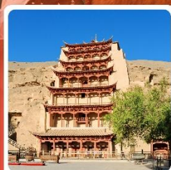
ถ้ำมั่วเกาตุ

ไฮไลท์! ถ้ำมั่วเกาตุ ถ้ำพุทธศิลป์โบราณ มรดกโลก UNESCO ภูเขาสายรุ้งจางเย่ ภูเขาหินสีสั่นแปลกตา หนึ่งในภูมิประเทศที่แปลกที่สุดในโลก