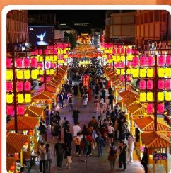
ตลาดกลางคีนซาโจว