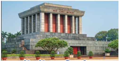
จัตุรัสบาติงห์