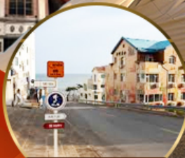
ถนนฮัจจรัป