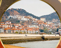
ซาจื่อเป่