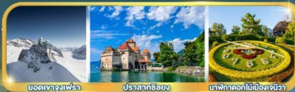
ยอดเขาจุงเฟร่า

กระเช้าไอเกอร์ : ยอดเขาจุงเฟร่า | กระเช้า : ยอดเขาโคลน์แมทเทอร์ฮอร์น กับ ดินแดนห้าหมู่บ้านชิงเกวแตรัส