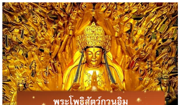
พระโพธิสัตว์กวนอิม

เช้า บริการอาหารเช้า ณ ห้องอาหารของโรงแรม นำท่านเดินทางสู่ มรดกโลกอุทยานผาหินแกะสลักต้าจู๋ ศิลปะหินแกะสลักอันล้ำค่า แห่งเมืองฉงชิ่งมรดกโลกที่องค์การยูเนสโกขึ้นทะเบียนเมื่อปี ค.ศ. 1999 ตั้งอยู่ทาง ตะวันตกของนครฉงชิ่ง ประเทศจีน ศิลปะหินแกะสลักเหล่านี้สร้างขึ้นตั้งแต่ราชวงศ์ถัง จนถึงราชวงศ์ซ่ง มีอายุมากกว่า 1,000 ปี โดดเด่นด้วยงานแกะสลักทางพุทธศาสนาที่ งดงามและยังคงสภาพสมบูรณ์ (ใช้เวลาเดินทางประมาณ 1-2 ชั่วโมง)